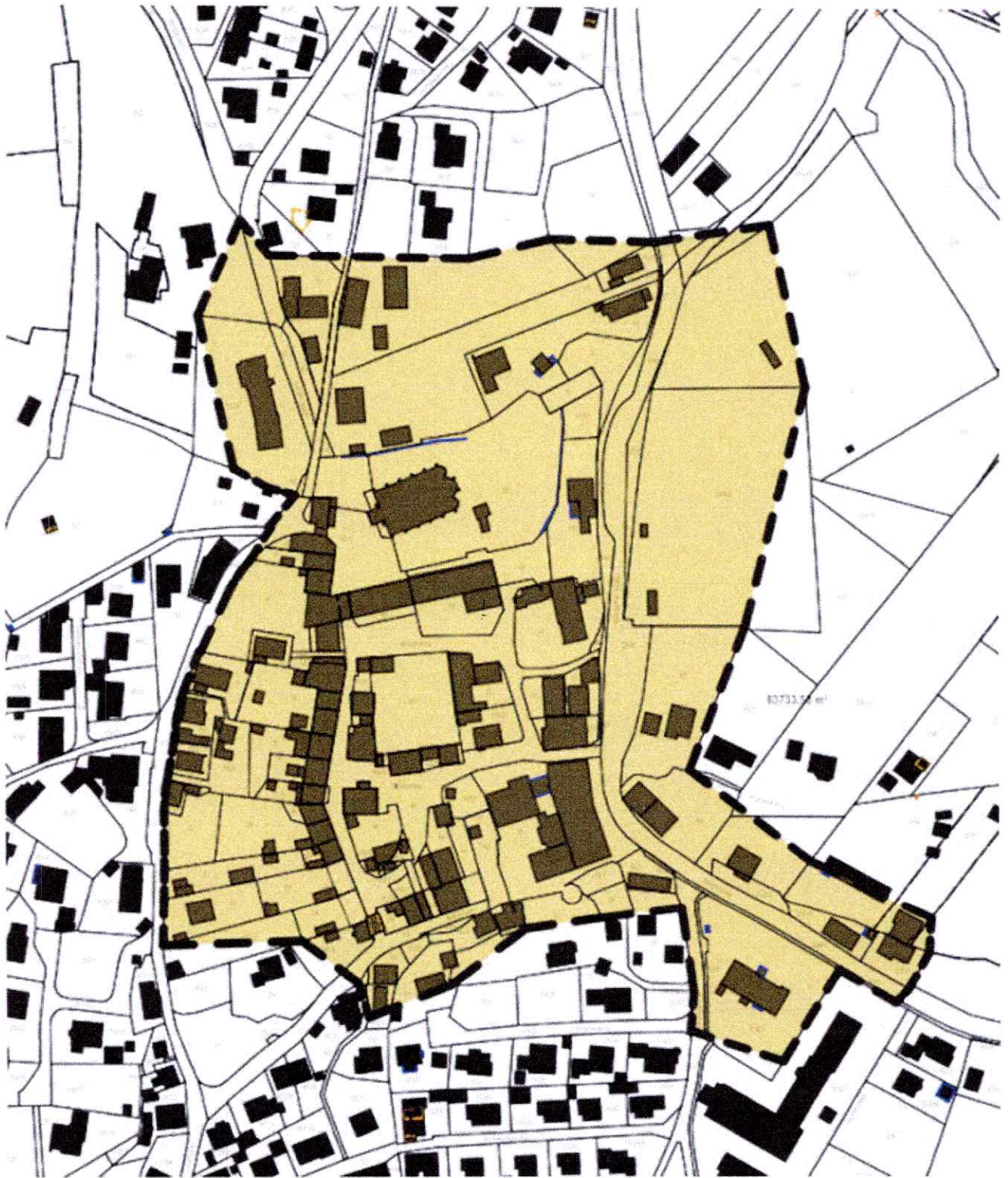
Abbildung Ingenieurkontor: Sanierungsgebiet