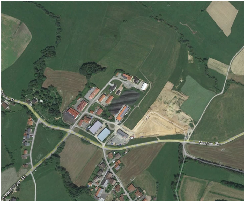
Luftbild Gewerbegebiet Auerbach

Der Gemeinderat Zachenberg hat in seiner Sitzung am 13.01.2025 die Aufhebung des Deckblattes zum Bebauungsplan „GE Auerbach II“ beschlossen.