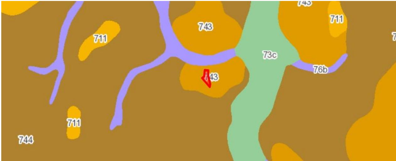
Abbildung 1 Bodenkarte Bayern aus BayernAtlas M 1:25.000

Die dem Planungsgebiet zuzuordnenden Flächen sind ohne bekannte kulturhistorische Bedeutung, im Bestand mit anthropogen geprägtem Boden.